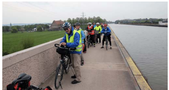
Am Wasserstraßenkreuz in Minden

straßenkreuz. Direkt an der Weser entlang geht es über Petershagen bis nach Schlüsselburg, dem letzten Ort an der Weser in Westfalen, dann weiter bis Stolzenau. Hier ist die erste Übernachtung.