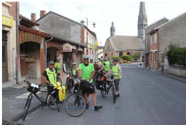
Auf dem Jakobsweg in Vienne le Chateau